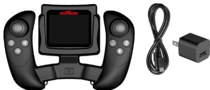
Charging by power supply 5V1A charger plug