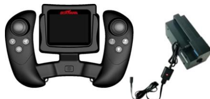
Charging by boat lithium battery